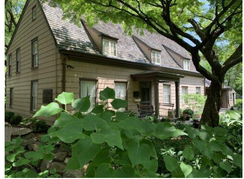
현재의 바운 주택

바운 주택(Bowne House)은 국내에서 앵글로-네덜란드 민간 주거용 건축의 가장 잘 보존된 표본이며, 그것은 계속해서 원래 위치를 점유하고 있다. 바운 주택이 된 구조물은 1661년 경 지어졌고, 그 가족이 성장하고 번성함에 따라 존 바운에 의해 1669년과 1680년 증축되었다. 그 주택의 현 기본 모습은 1815년 완성되었다.