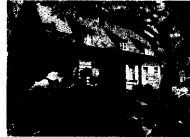
The Bowne House today

邦恩故居是本國保存最完好的盎格魯-荷蘭式民居建築例子，並且繼續佔據其原始位置。成為邦恩故居的建築框架始建於 1661 年，並在約翰·邦恩於 1669 年和 1680 年隨著他家族成員